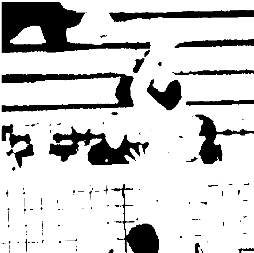
Trento vuole contare al più presto su un Juantorena recuperato. Sopra una colonna: Stokr