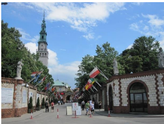
Santuario di Czestochowa